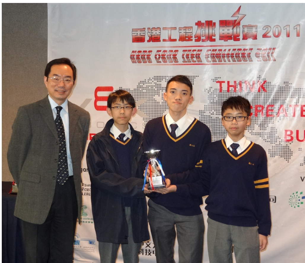
本校參賽同學接受嘉賓頒發「Create Award 創造獎」